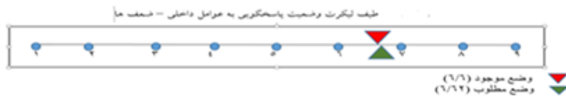
نمودار شماره ۲: نمودار موقعیت ضعف‌ها

موقعیت و امتیاز ضعف‌ها در «شرایط موجود» و «شرایط مطلوب» روی ماتریس ارزیابی موقعیت و اقدام راهبردی به شرح ذیل است: