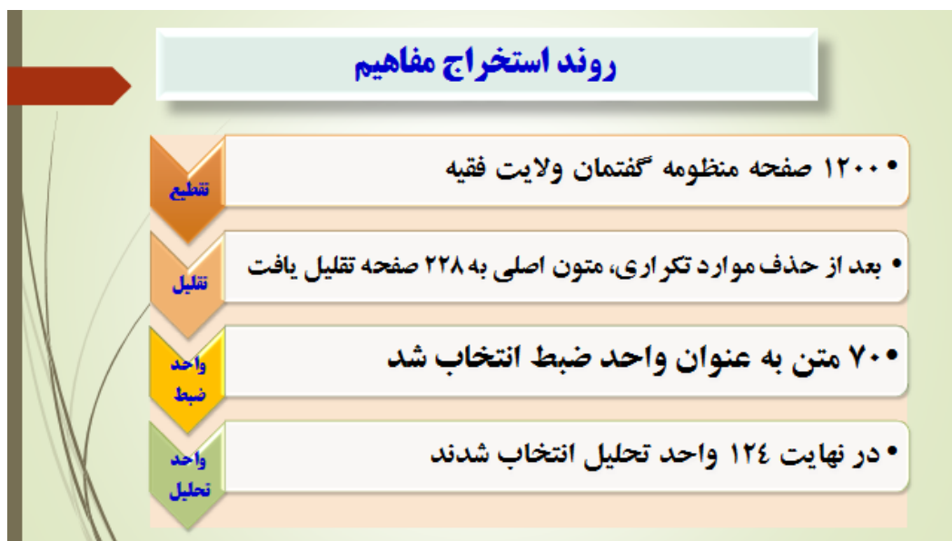
شکل ۱- روند استخراج مفاهیم از گفتمان ولایت فقیه

روش نظریه پردازی و مراحل اجرای آن با استفاده از روش داده بنیاد