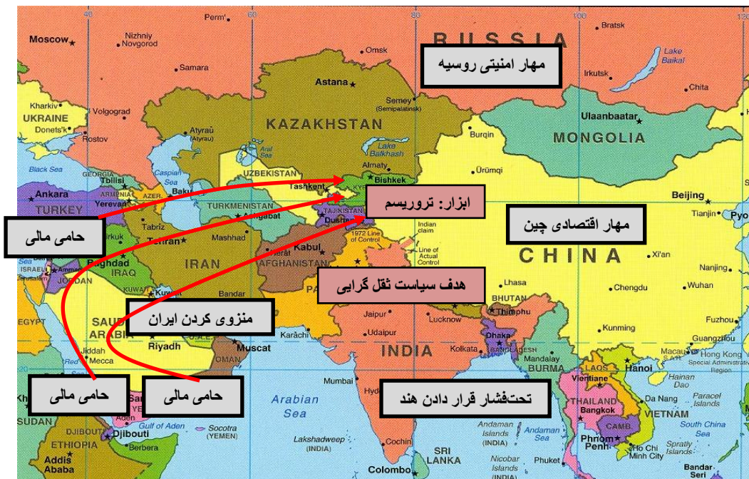
شکل ۲: جهت‌گیری و هدف سیاست ثقل گرایی آسیایی

به تروریست‌های داعش در عراق کمک می‌کند ( http://www.irdc.ir ).