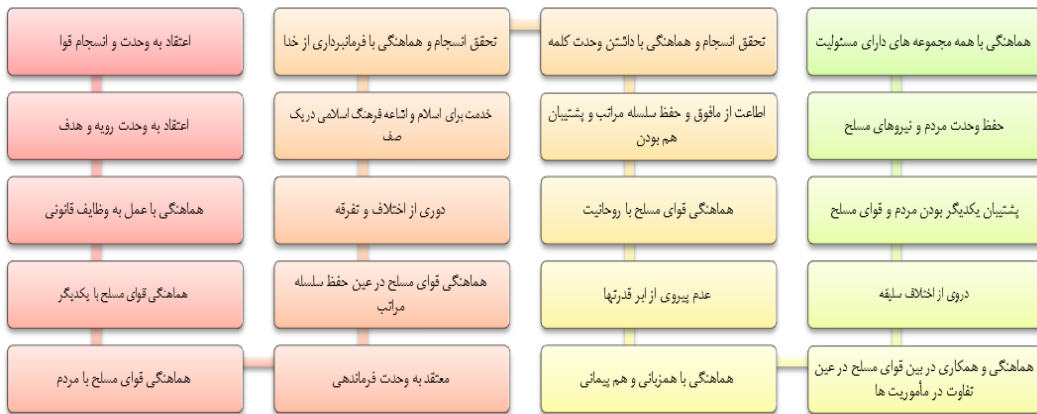
جدول شماره ۶ شاخص‌های احصاء شده مؤلفه هماهنگی برون سازمانی