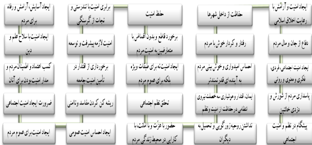
جدول شماره ۳ شاخص های احصاء شده مؤلفه امنیت عموم

مؤلفه حفظ و ارتقاء امنیت ملی از ۱۲ شاخص تشکیل گردیده که با حذف شاخص های تکراری،