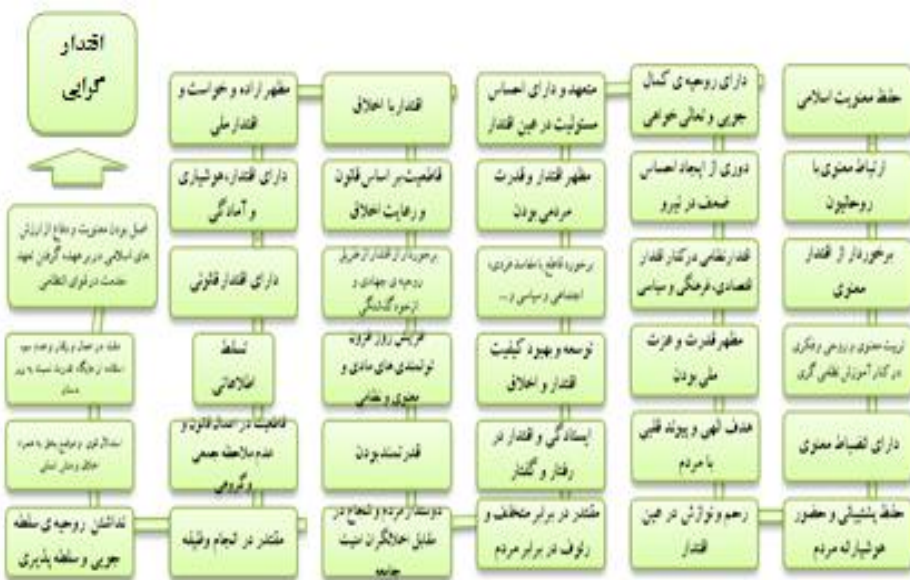
جدول شماره ۲ شاخص‌های احصاء شده مؤلفه اقتدارگرایی اسلامی